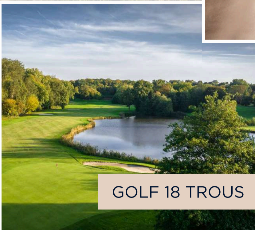
GOLF 18 TROUS